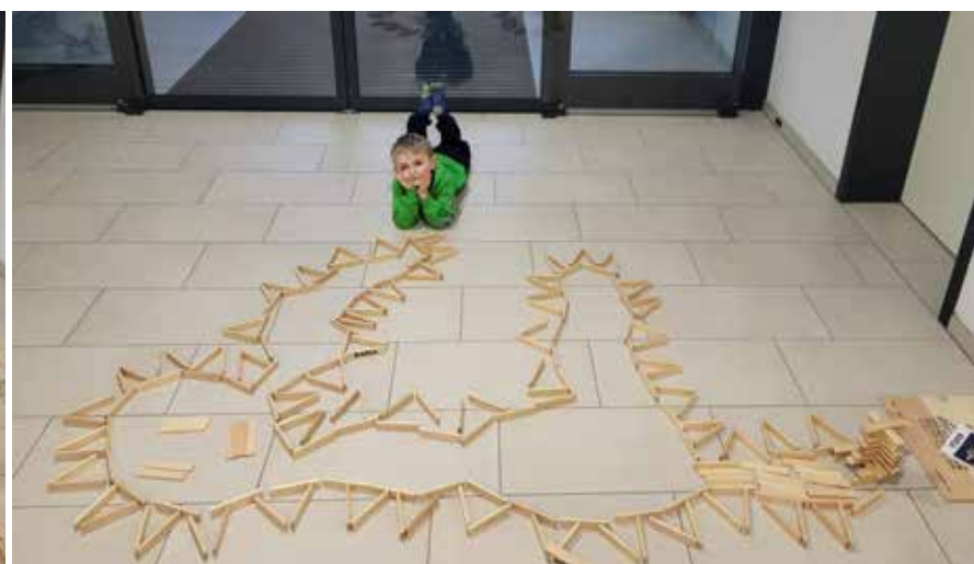
Selbst gebauter Dino auf dem Spielplatztreff Lotti.