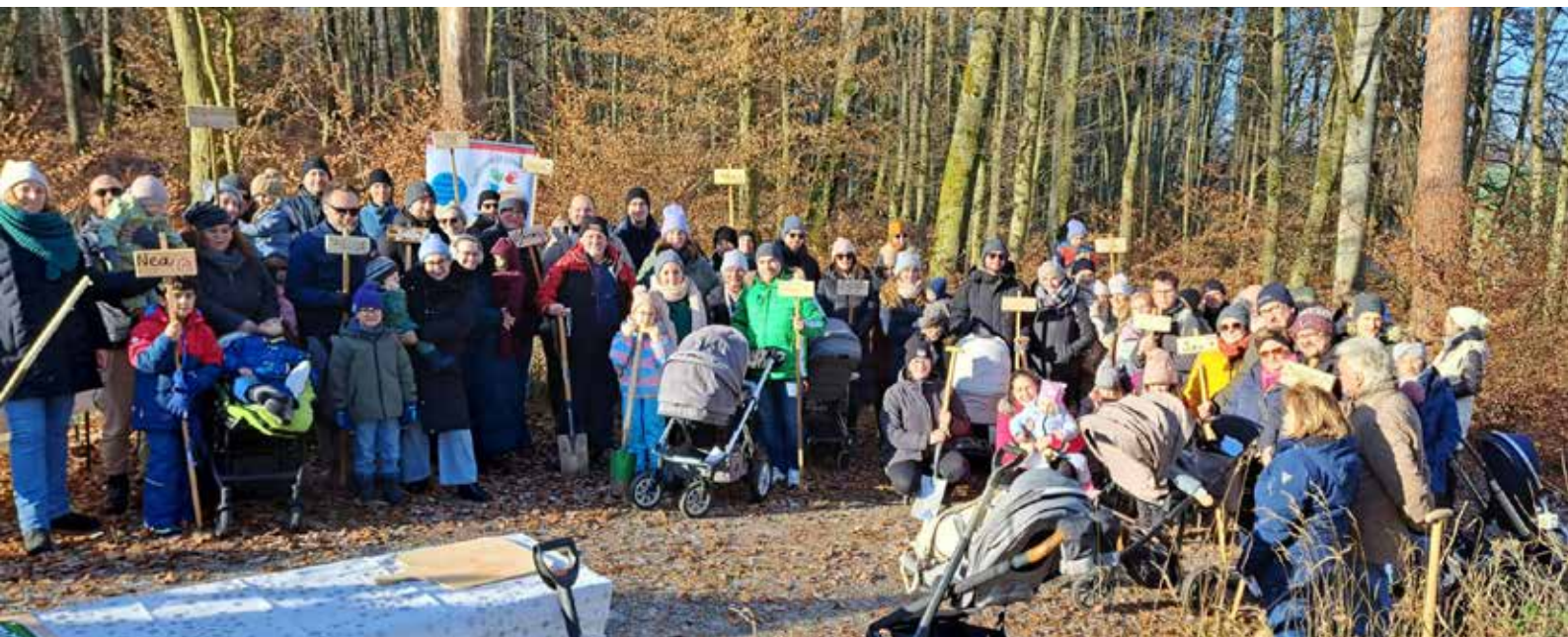
Familien pflanzen Bäume für Neugeborene.