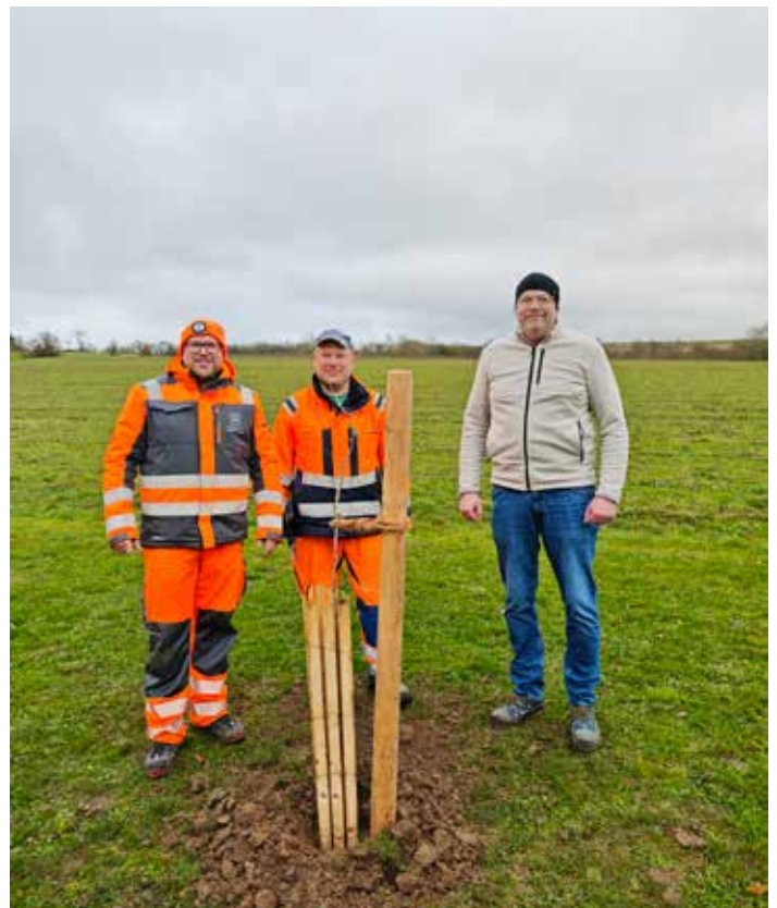
Gemeinsam machen wir unsere Gemeinde ein Stückchen grüner!

Unter dem Motto „Kirche an anderen Orten“ findet um 16 Uhr im Foyer des Landratsamts Würzburg, Zeppelinstraße 15, ein besonderer Gottesdienst mit musikalischer Begleitung statt. Für die Besucherinnen und Besucher stehen außerdem Getränke zur Erfrischung bereit.