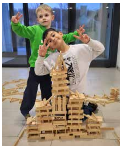
Große Baumeister auf dem Spielplatztreff Lotti